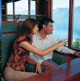
GoldenPass Belle Époque