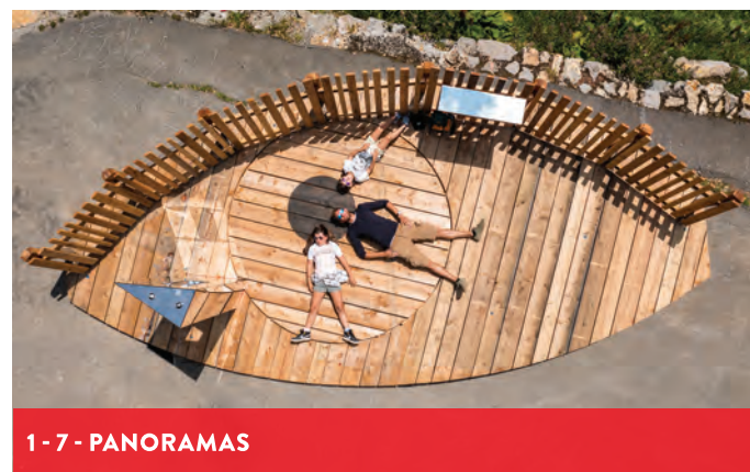
1-7 - PANORAMAS