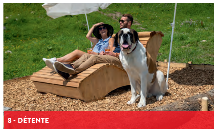
8 - DÉTENTE