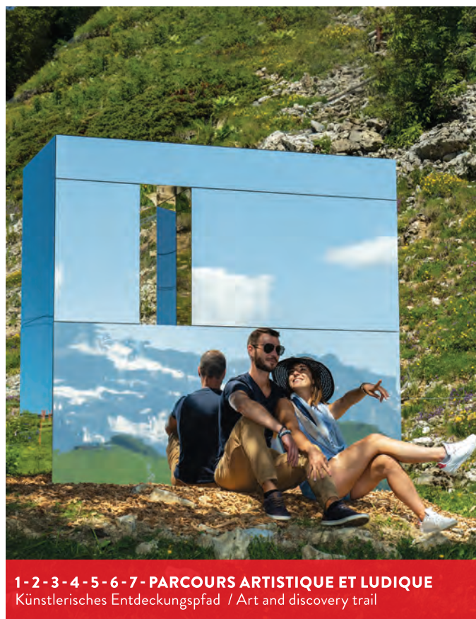
1-2-3-4-5-6-7 - PARCOURS ARTISTIQUE ET LUDIQUE Künstlerisches Entdeckungspfad / Art and discovery trail