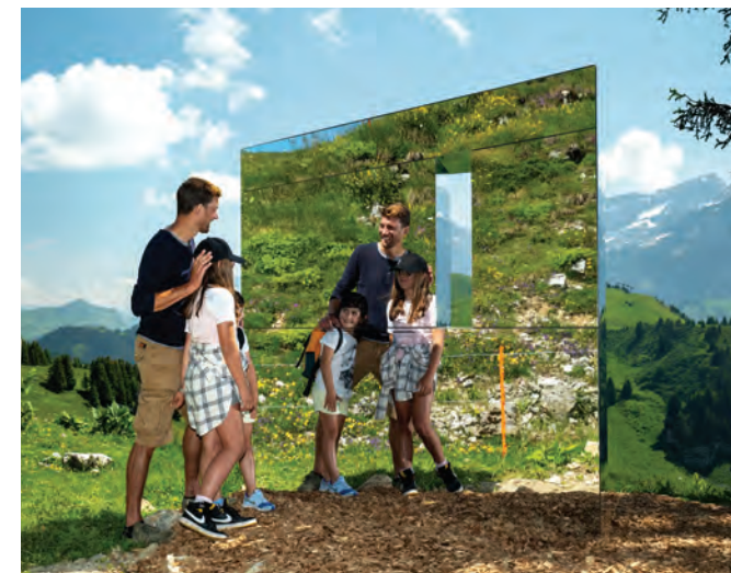
1-2-3-4-5-6-7 - PARCOURS ARTISTIQUE ET LUDIQUE Künstlerisches Entdeckungspfad / Art and discovery trail