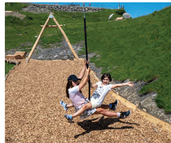
8 - TYROLIENNE ET TOBOGGAN Tiroler Traverse und Rutsche / Tyrolean traverse and slide