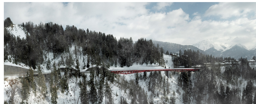
vue depuis Villars-sur-Ollon